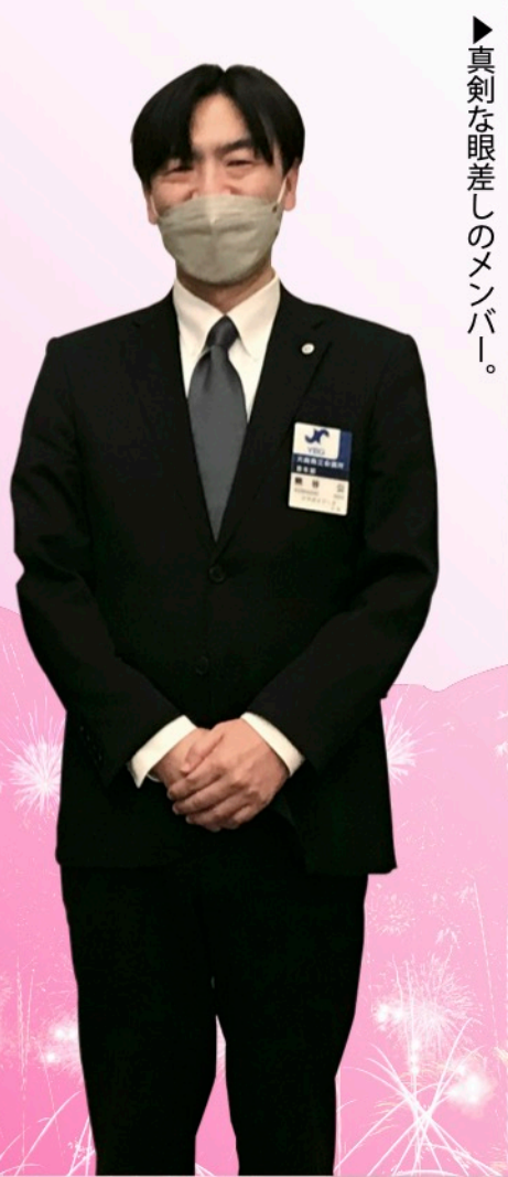
▶ 真剣な眼差しのメンバー！